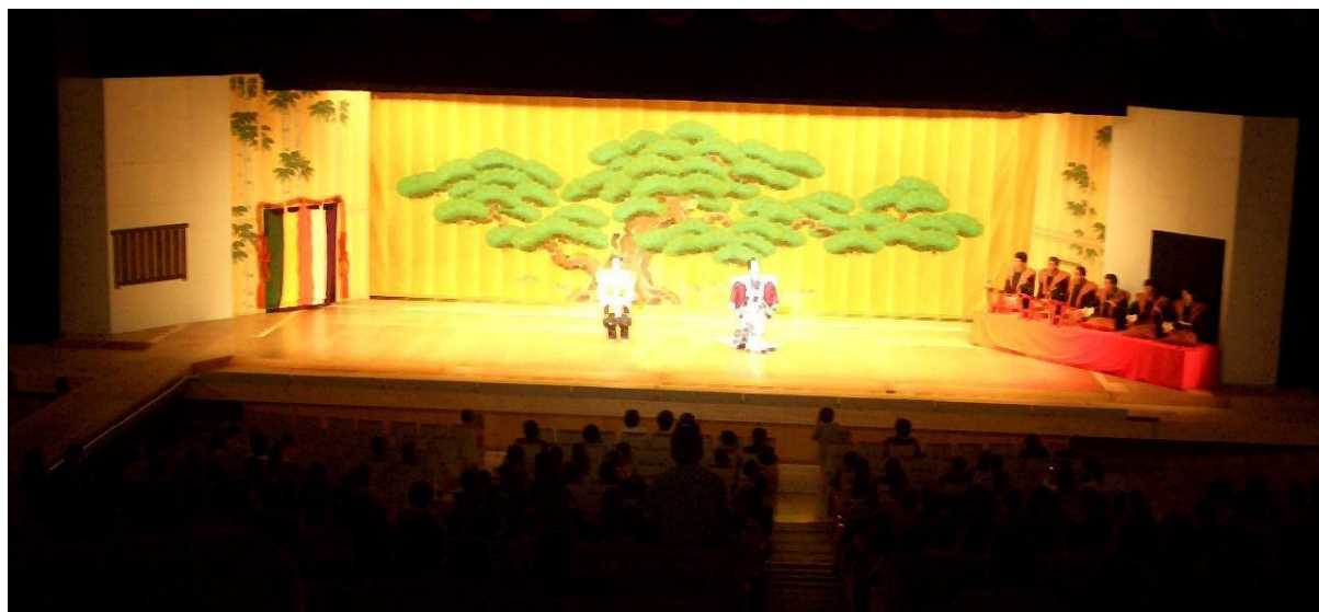
「舞台イメージ」 ※所作台、本花道等セットされています、参考イメージ

音楽センターでは主に舞踊・歌舞伎などに使われる総ヒノキの所作台や本花道などをご用意できます。セットに相当のお時間をいただきますので、ご利用の際には進行について予めご相談ください。また演劇などのご利用も可能ですが、吊物を多く使用する催しについては、舞台の構造上、舞台天井に十分な高さがありません（約9m）ので、ご注意ください。（舞台寸法を記した舞台図面をご用意しています）