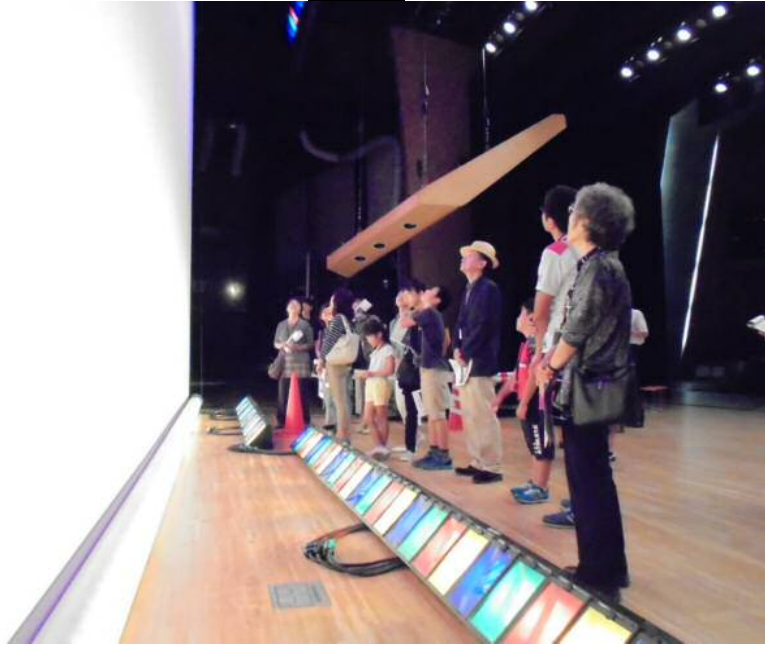
ホリゾンライト(後ろの白い幕にカラフルな光を当てる)の実演