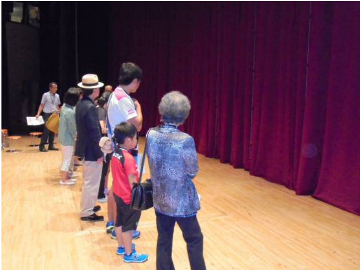
幕が閉まって、何かが起きそうな予感？！