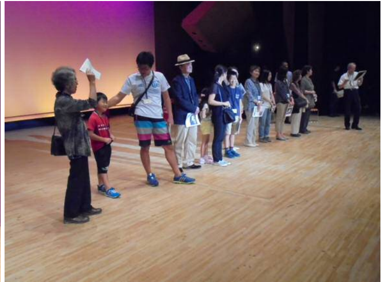
幕が上がりました！ 写真だとわかりづらいですが、皆さんに照明が当たっています！