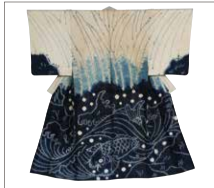
《浅舞紋「波に鯉文様」木綿着物》