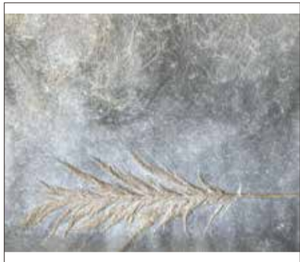
森田千晶《空徑》(部分)2024年 和紙ほか 作家蔵