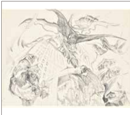
山田かまち《都会の怪鳥》1975年 鉛筆・紙