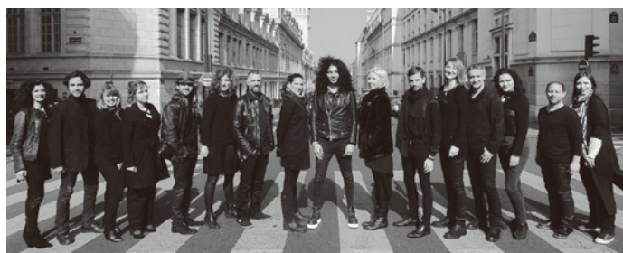
photo:Nemanja Radulović©Hiroimichi Nozawa, Double Sens©Edouard Brane