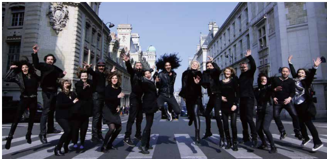
ドゥーブル・サンス [弦楽合奏&ピアノ・チェンバロ]