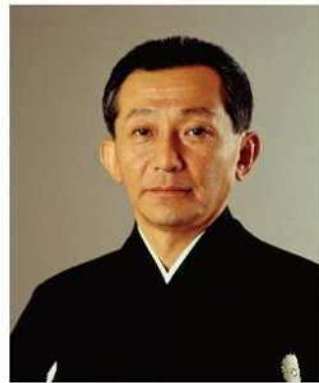
二十六世観世宗家 観世 清和