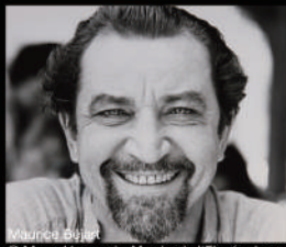
Maurice Béjart