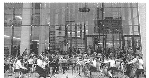
高崎市少年少女オーケストラ