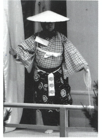
狂言：「木六駄」