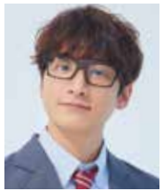
有馬公生 (Wキャスト) 小関裕太