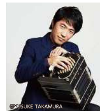
小松亮太